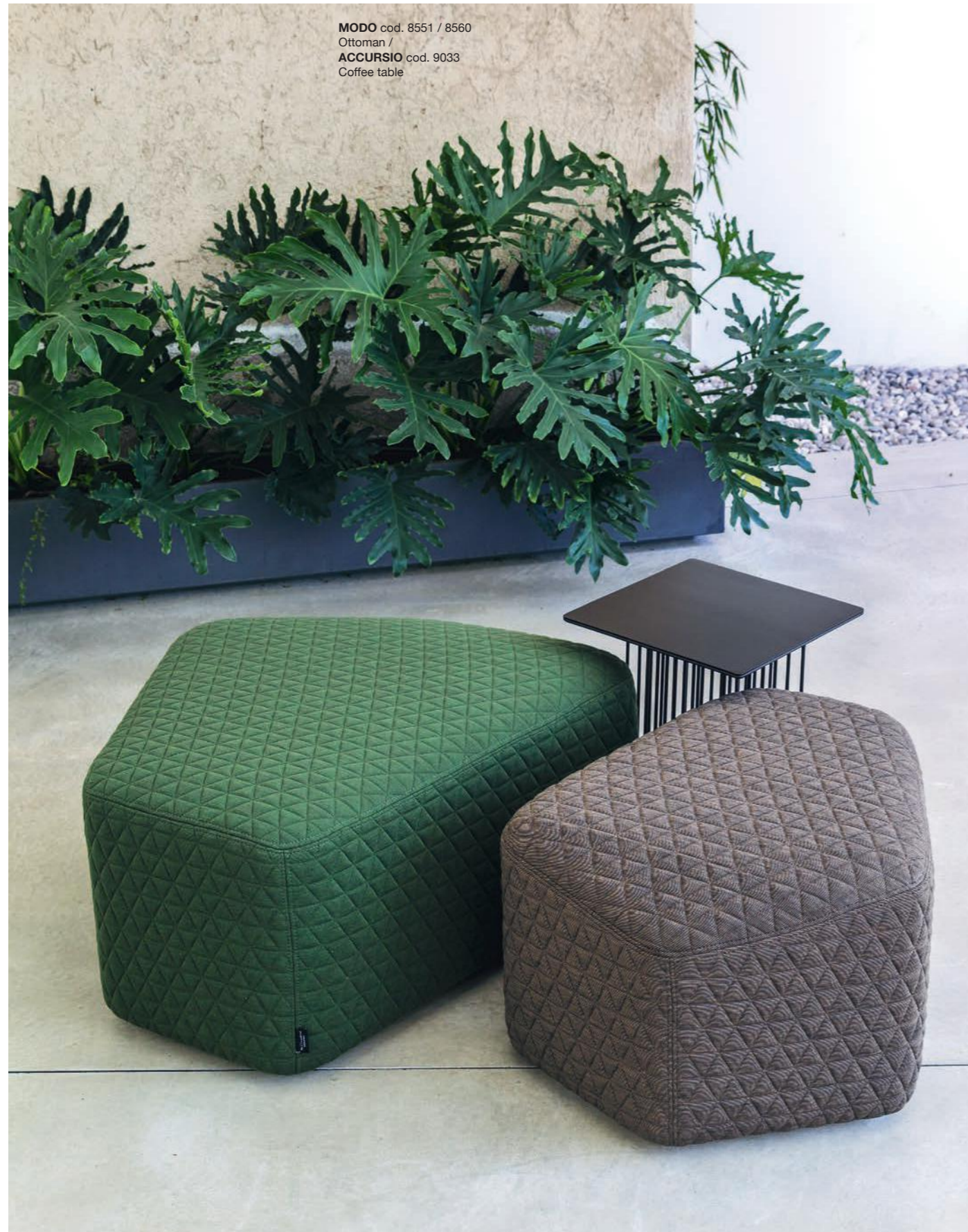
MODO cod. 8551 / 8560 Ottoman / ACCURSIO cod. 9033 Coffee table