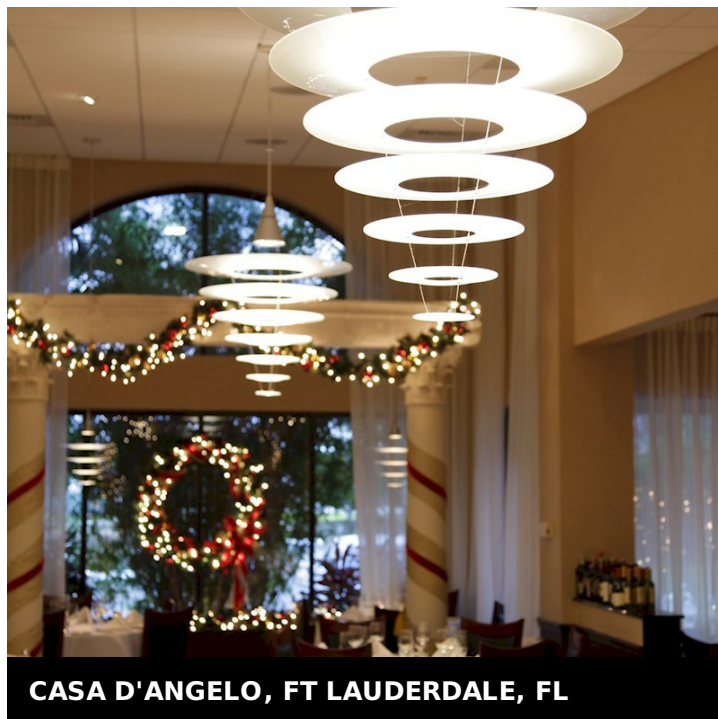
CASA D'ANGELO, FT LAUDERDALE, FL