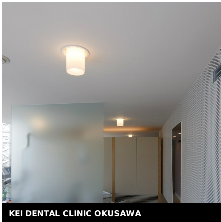
KEI DENTAL CLINIC OKUSAWA